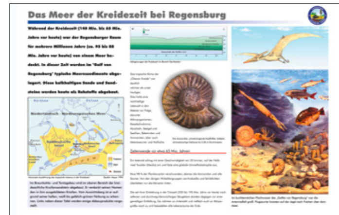
Beispiel einer Lehrpfadtafel